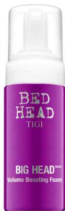
125 ml UVP: 22,90€