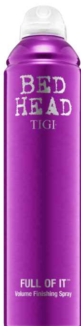
371 ml UVP: 21,00€