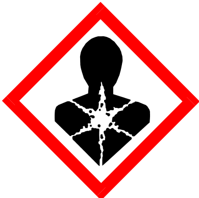
C-M-R, Sensibilisierend, STOT, obere Kategorie