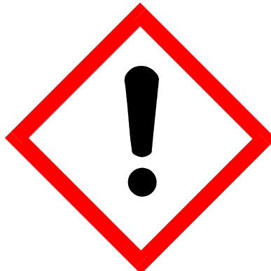
C-M-R, Sensibilisierend, STOT, untere Kategorie