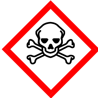
Sehr Giftig, Giftig